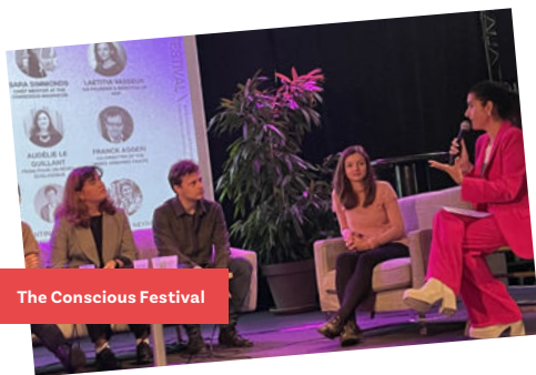
The Conscious Festival

Ces interventions (tables-rondes, conférences, ateliers, stands, webinaires) lui ont permis de sensibiliser près de 3400 personnes à la lutte contre l'obsolescence programmée, qu'il s'agisse d'étudiants, de professionnels, de familles ou même d'élèves d'école primaire.