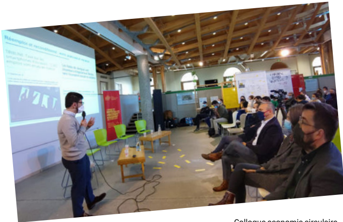
Colloque économie circulaire.

Le Club de la Durabilité a également co-organisé le colloque “Economie circulaire et durabilité” le 10 février 2022 avec HOP, en partenariat avec SOLTENA, la Région Nouvelle-Aquitaine, RECITA et la Maison écocitoyenne de la ville de Bordeaux. Le rapport du Club de la Durabilité 2021 y a été présenté et plusieurs entreprises ont participé à des tables rondes (Murfy, Back Market, Gouach). Le résumé vidéo de l'événement est disponible sur la chaîne Youtube de HOP.