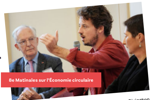
8e Matinales sur l'Économie circulaire