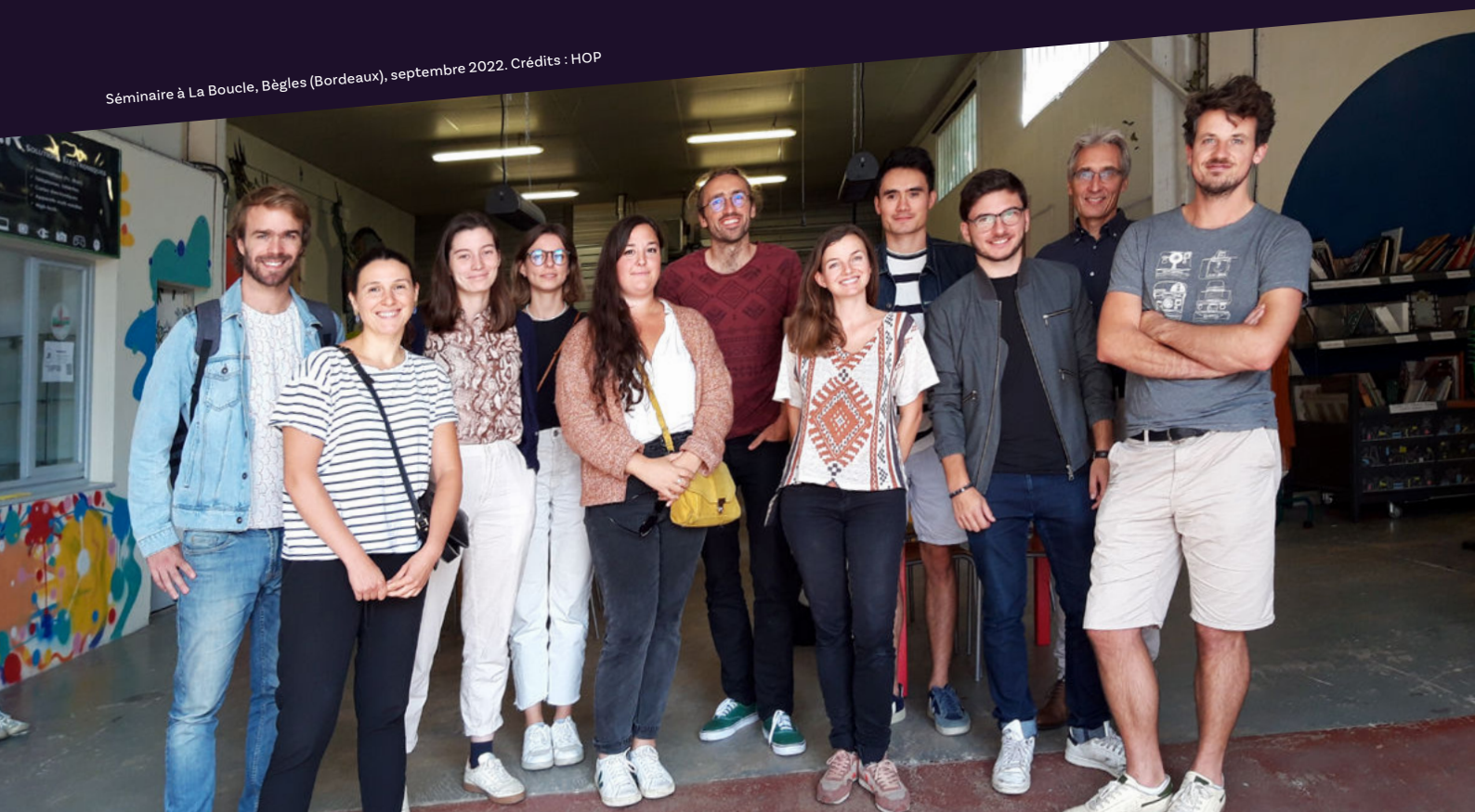
Séminaire à La Boucle, Bègles (Bordeaux), septembre 2022.

Enfin, sept ans après sa fondation, c'est toujours la même énergie qui anime HOP dans les luttes qui l'ont vu naître. Son combat n'est possible que grâce à la communauté soudée de bénévoles marchant en tandem avec l'équipe permanente qui la compose et dont l'implication ne se dément pas au fil des années.