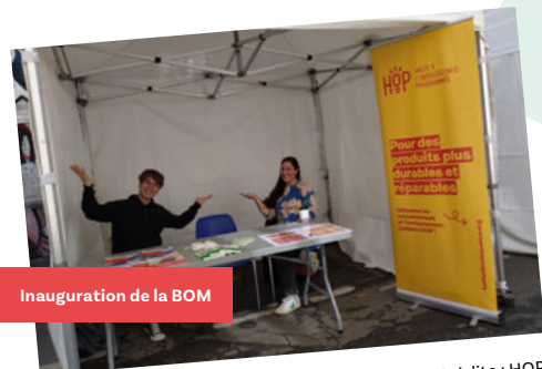
Inauguration de la BOM